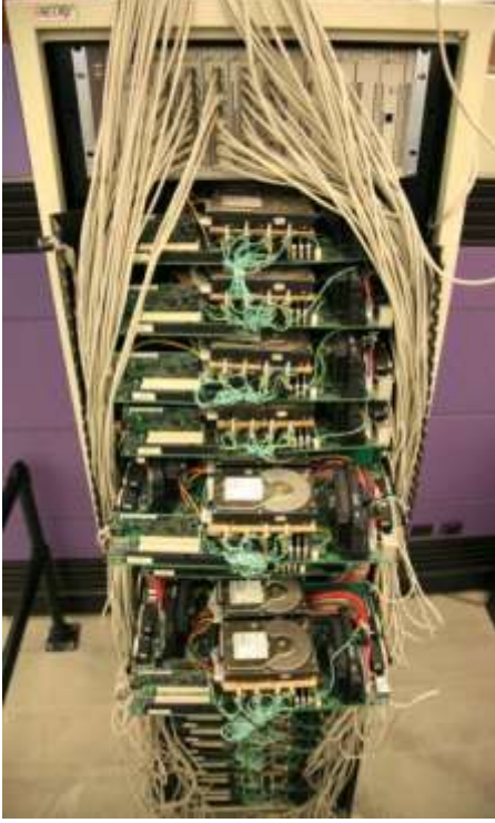
Larry'nin Google için yaptığı ilk sunucu

sırasına göre dizerek sundular. Böylece, araştırma yapanlar hem zaman kazanacak hem de doğru bilgilere ulaşacaktı.