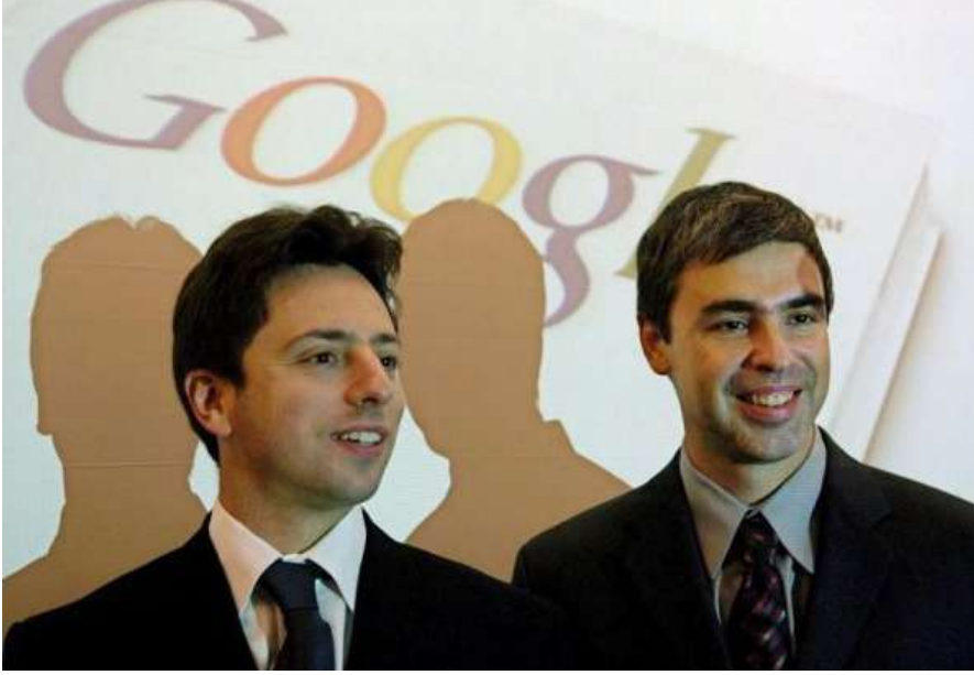
Sergey Brin ve Larry Page

L. Page ve S. Brin, Stanford'da doktora yaparken Google'ı geliştirdi. Değeri 2012'de 210 milyar dolar olan şirket 1999'da 1 milyon dolara satılamamıştı.